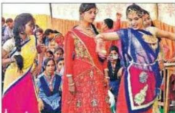
केएनपीजी कालेज में बुधवार को रोवर्स-रैंजर्स समागम पर सांस्कृतिक कार्यक्रम प्रस्तुत करती छात्राएं। (बाएं) व विजेता टीम के रोवर्स-रैंजर्स को पुरस्कृत करते प्रमुख अतिथि।

नरेश राजकीय स्नातकोत्तर शालय मैदान में चल रहे दो दिवसीय जनपदीय रोवर्स-रैंजर्स का समापन बुधवार को दो दिवसीय रोवर्स-रैंजर्स में लघु स्पर्धा, झांकी, फैंस फायर, नृत्य प्रतियोगिताएं व क्विज प्रतियोगिताओं में प्रतिभागियों ने जौहर दिखाए। समागम में जिले के पांच महाविद्यालयों के प्रतिभागियों ने हिस्सा लिया जिसमें ज्ञानपुर केएनपीजी कालेज चैंपियन रहा, डा.श्यामा प्रसाद मुखर्जी राजकीय महाविद्यालय द्वितीय रहे। केएनपीजी की टीम ओबरा में होने वाले समागम में हिस्सा लेने के लिए बुधवार खाना होगी।